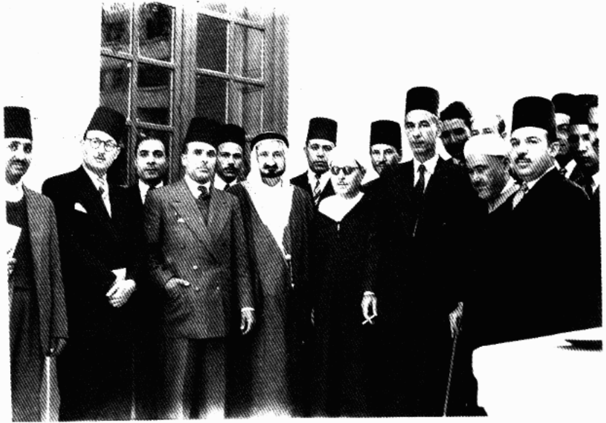
المؤلف عن يمين المجاهد محمد بن عبد الكريم الخطابي في مقر الجامعة العربية بالقاهرة وعن يساره عبد الرحمن عزام الأمين العام لجامعة الدول العربية وأخوه محمد الخطابي والسيد ياسين، نائب وزير الخارجية السعودي والحبيب بورقيبة رئيس الحزب الحر الدستوري التونسي وشخصيات أخرى.